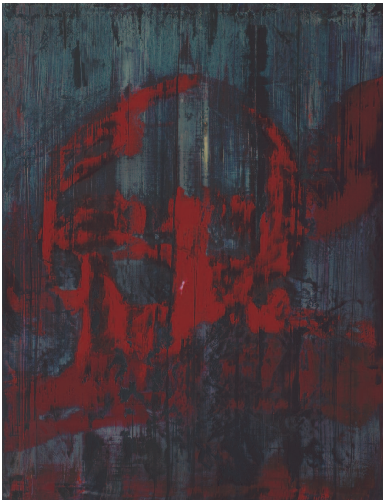
“Crâne” 116 x 89 cm, Huile / Toile, 2008