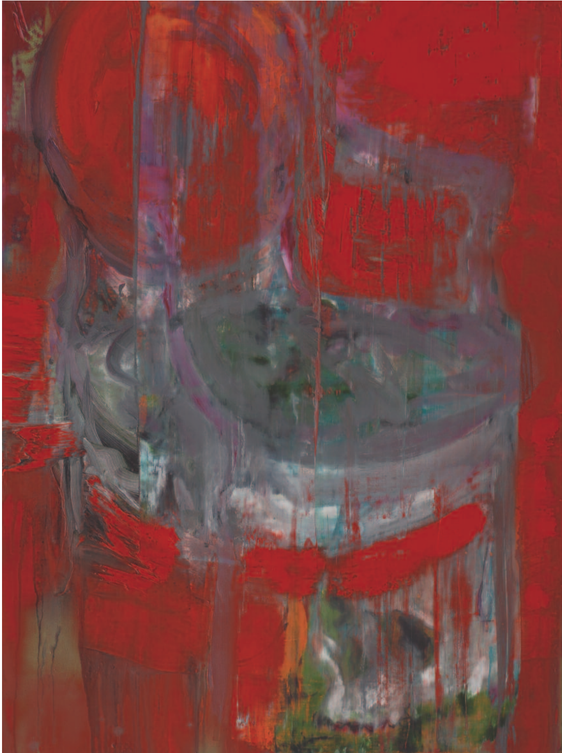
"Sans Titre" 130 x 97 cm, Huile / Toile, 2008

Puls'art 2009 Musée de Tessé du 24 Avril au 22 Juin 2009