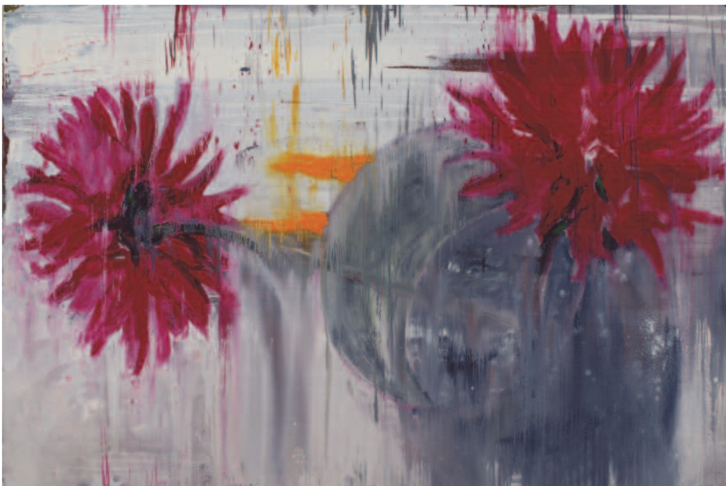
“Sans Titre” 189 x 130 cm, Huile/ Toile, 2007