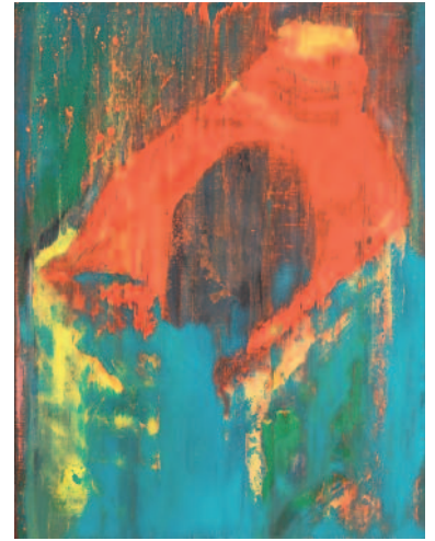
"Bidon" 50 x 65 cm, Huile / Toile, 2007