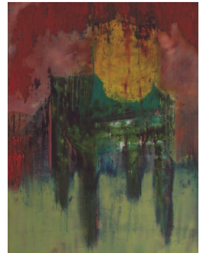
"Sans Titre" 130 x 97 cm, Huile/ Toile, 2007