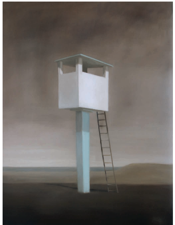
Le guetteur - 116 x 89 cm - huile / toile - 2017