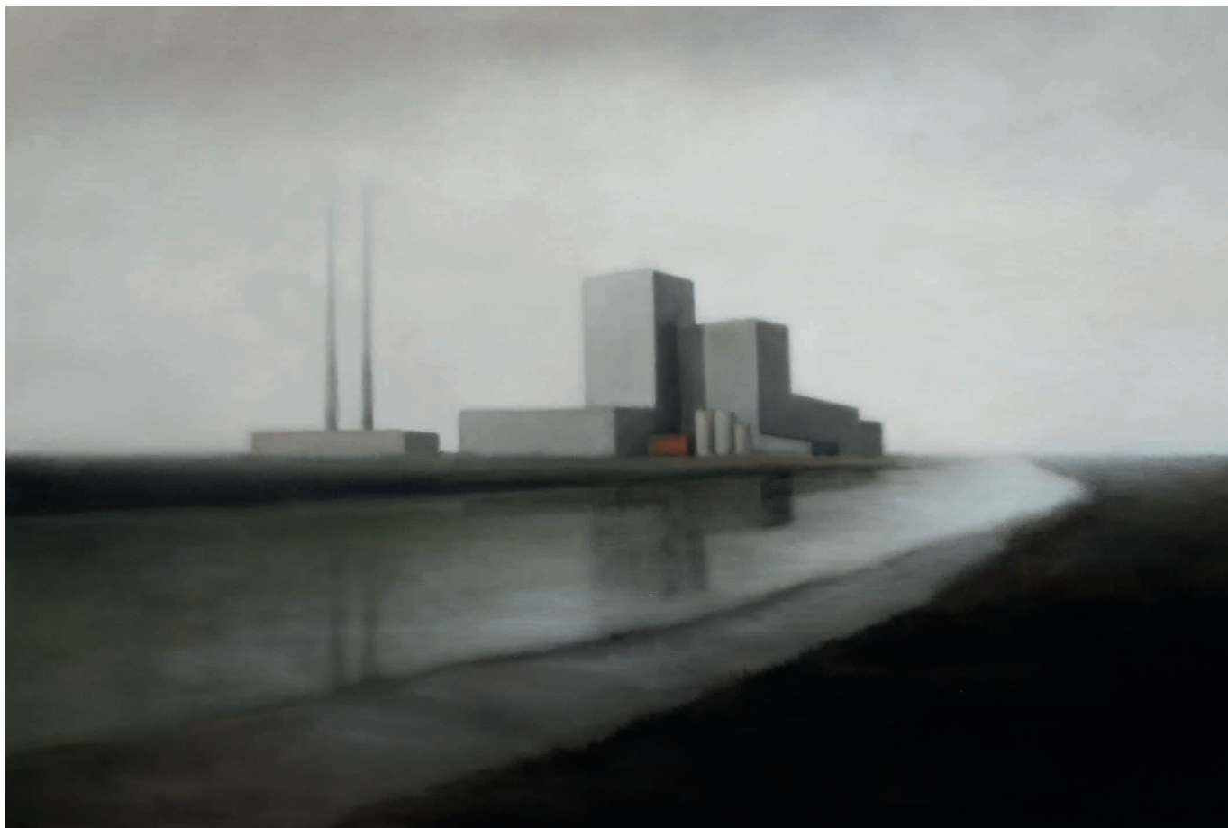
Site industriel 153 - 114 x 162 cm - huile / toile - 2012