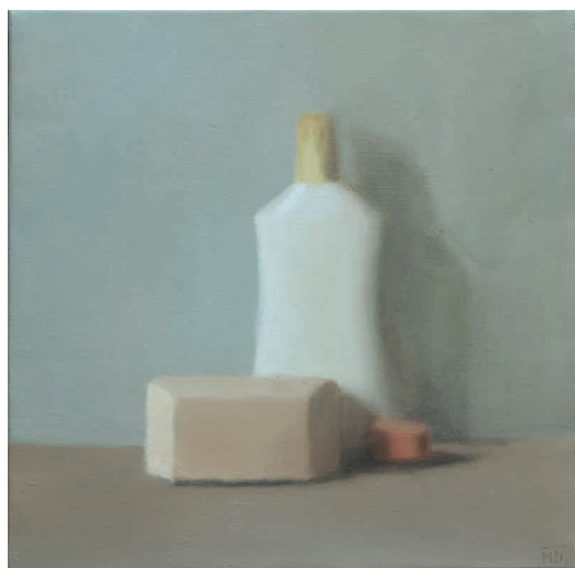
Plastiques 21 - 30 x 30 cm - huile / toile - 2016