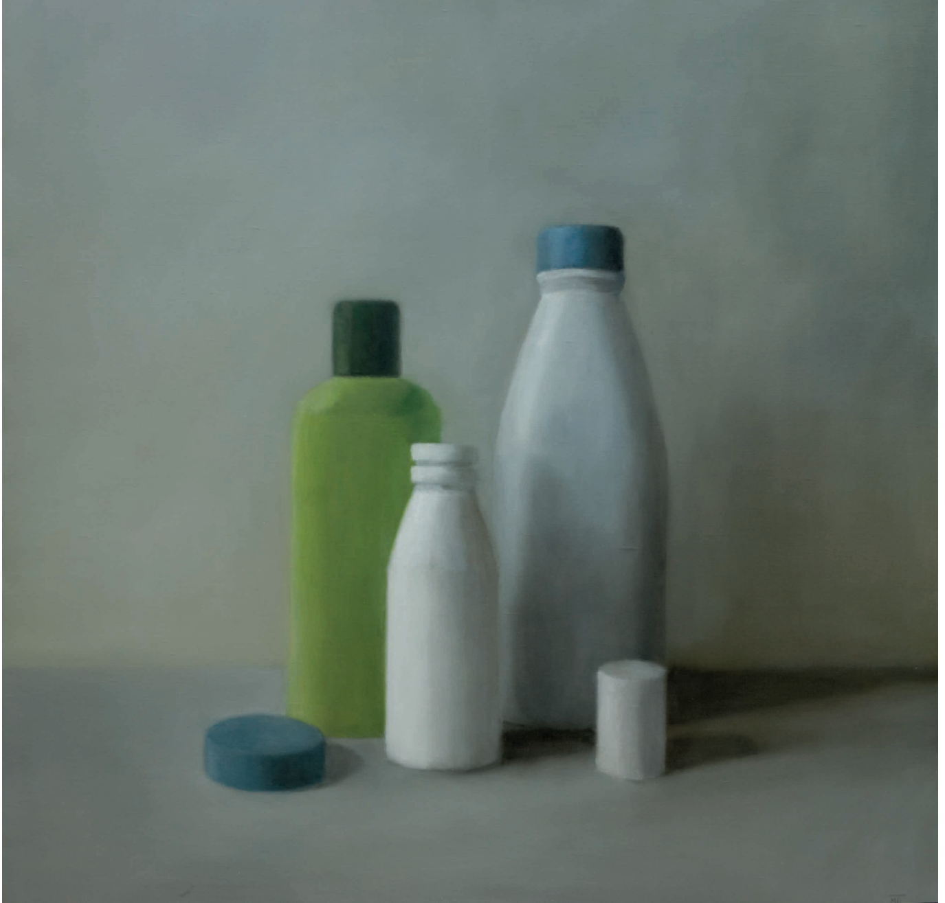
Plastiques 9 - 100 x 100 cm - huile / toile - 2013