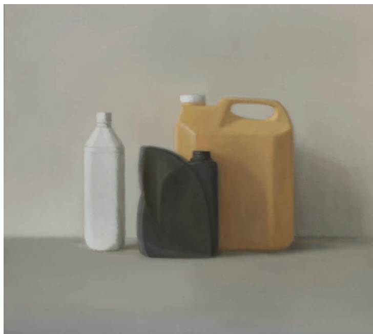
Plastiques - 80 x 80 cm - huile / toile - 2014