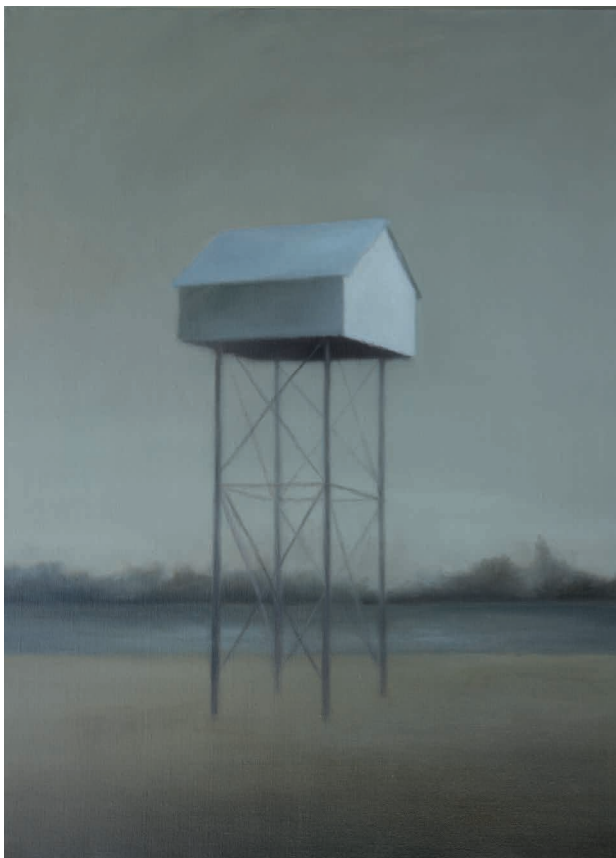
Habiter les nuages - 81 x 60 cm - huile / toile - 2016