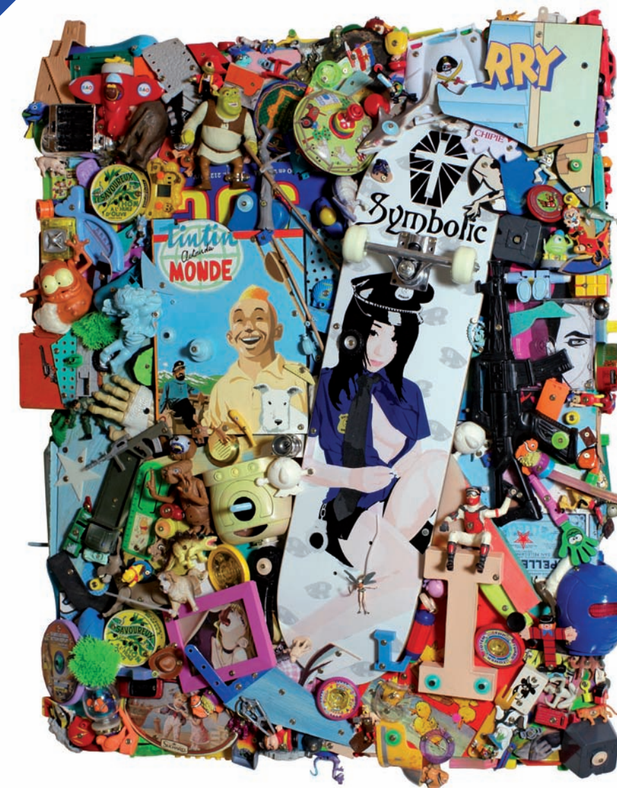
Eric Liot Collégiale St Pierre la Cour

2 Av Paderborn du 2 au 5 Juin vernissage mercredi 1 Juin à 18 h 30 60 artistes sélectionnés