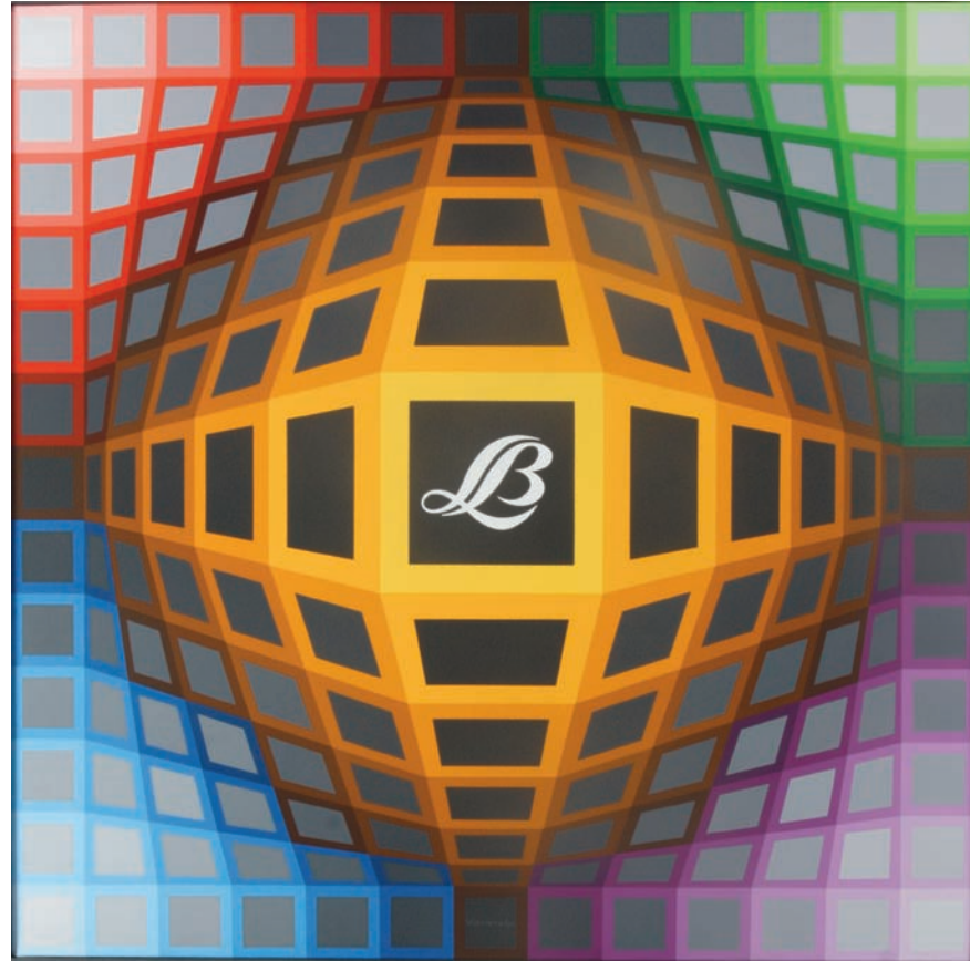
La Collection "Lefranc & Bourgeois" Musée de Tessé