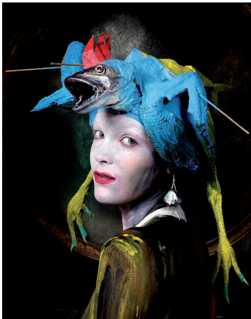
Barré Parc Monod